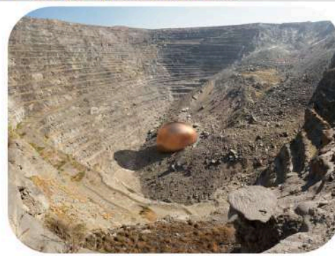
Palabora Mine (South Africa) - 4.1 million tonnes of copper = 458 612,97 m 3 = 122 piscines olympiques

Sur le climat : la fabrication d'un smartphone ou d'une télévision nécessite une grande quantité d'énergie (pour l'extraction des minerais, la transformation des matériaux ou le transport par exemple). Dans les pays où sont fabriqués nos équipements numériques, l'énergie utilisée est principalement d'origine fossile (pétrole, charbon, gaz). La production de cette énergie émet des gaz à effet de serre et ceci participe au changement climatique.