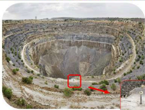
Koffiefontein Mine (south Africa) 7.6 million carats of diamonds = 1520kg = 0,4318 m 3